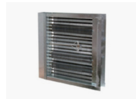
Bateria de resistências alhetadas Finned heaters batterie