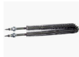
Resistência com alhetadas espiral Round finned heaters