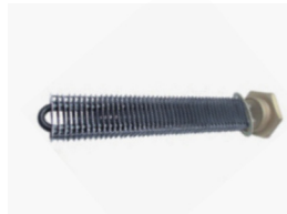
Resistência alhetada com flange Finned heaters with flange