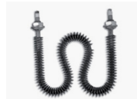
Resistência com alhetadas espiral Round finned heaters