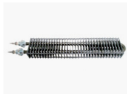
Resistência com alhetadas retangulares Rectangular finned heaters

Rectangular: 50x25mm, standard size (others by request)