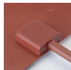
Saída 2 Output 2