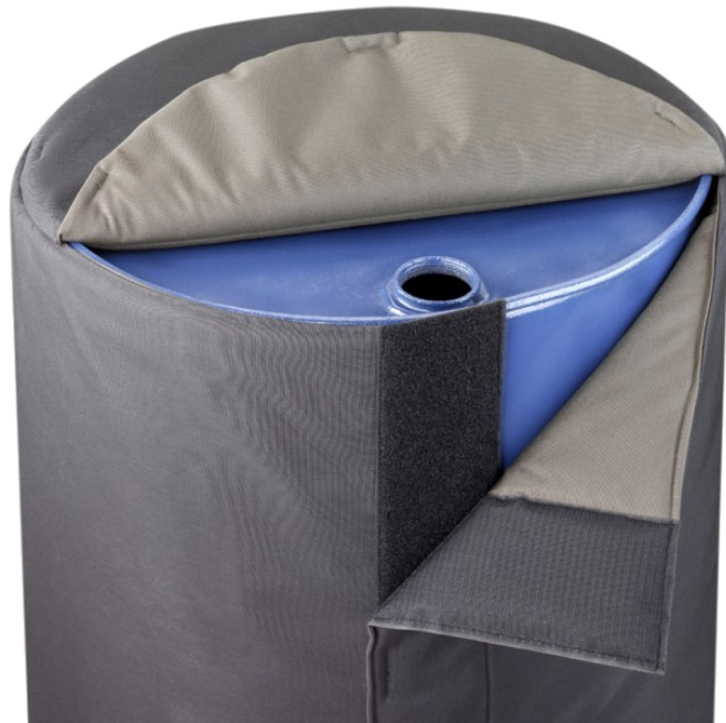
Manta de isolamento para bidões de 200l Insulated jacket 200l drums