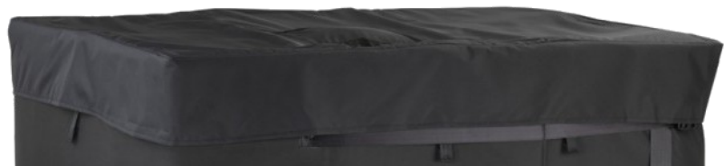
Tampa para complemento da manta de isolamento Additional fixing to the top of the IBC container