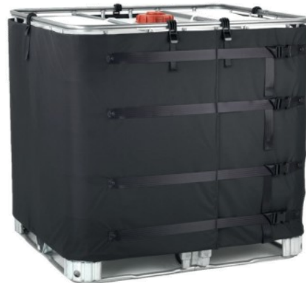
Manta de isolamento para bidões contentores IBC Insulated jacket for IBC containers

To avoid heat losses during transport to the point of use and after heating via an alternative process such as ovens or hot fills. This is supplied with easy release buckles and fixing hooks for additional fixing to the top of the IBC. A lid is also available to help reduce heat loss.