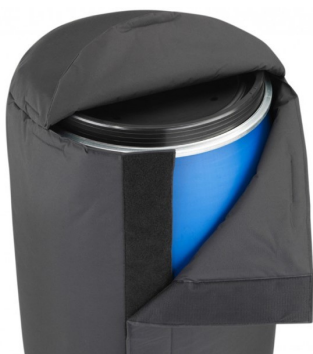
Manta de isolamento com velcros Insulated jacket with velcro's